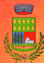
Comune di Onore