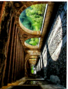
Via Porticata - Averara