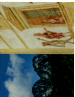
Serenata Macabra - Cassiglio